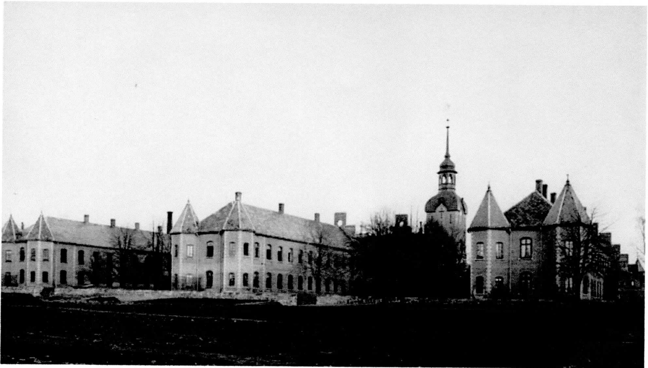
PSYKIATRIENS HØYBORG: Gaustad sykehus var landets mest moderne psykiatriske sykehus da det stod ferdig i 1855.