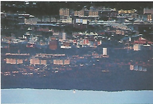
ULIKHET I NORGE

Selv om det er like mange som får kreft i de to delene av byen, er det ikke tilfeldig hvem som dør.