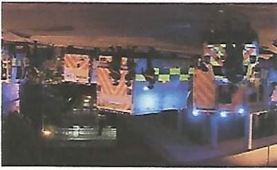
TERROR I MANCHESTER

Konserthokaler er enkle mål med mange mennesker samlet på ett sted, mener terrorforsker. Mandag ble 22 personer drept i en eksplosjon ved Manchester Arena.