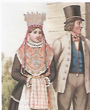
"Brudepar i bunad."

Hundre år senere hadde unge mennesker fått langt større frihet i valg av ektemake.